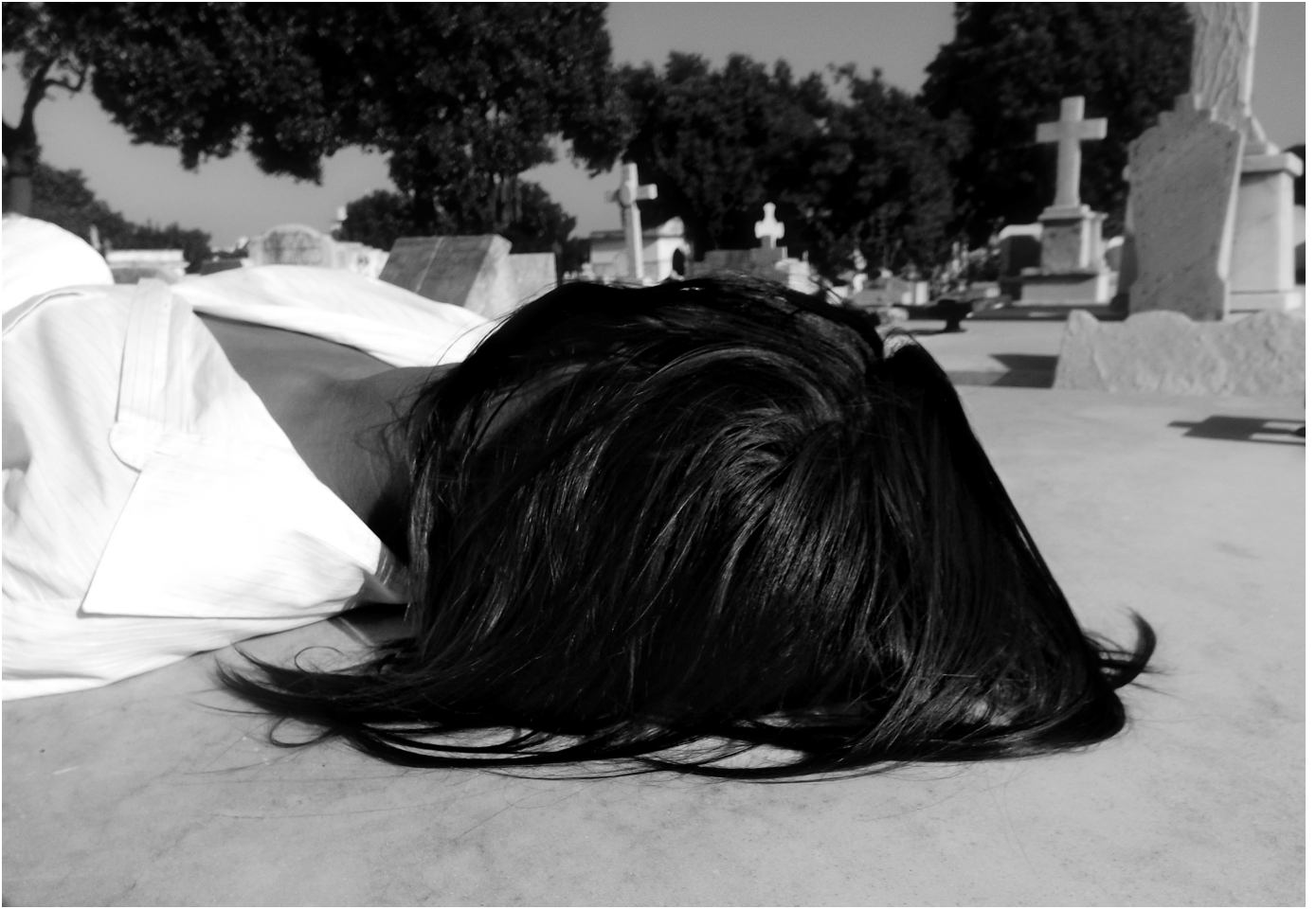
Cuando el ángel llega al descanso