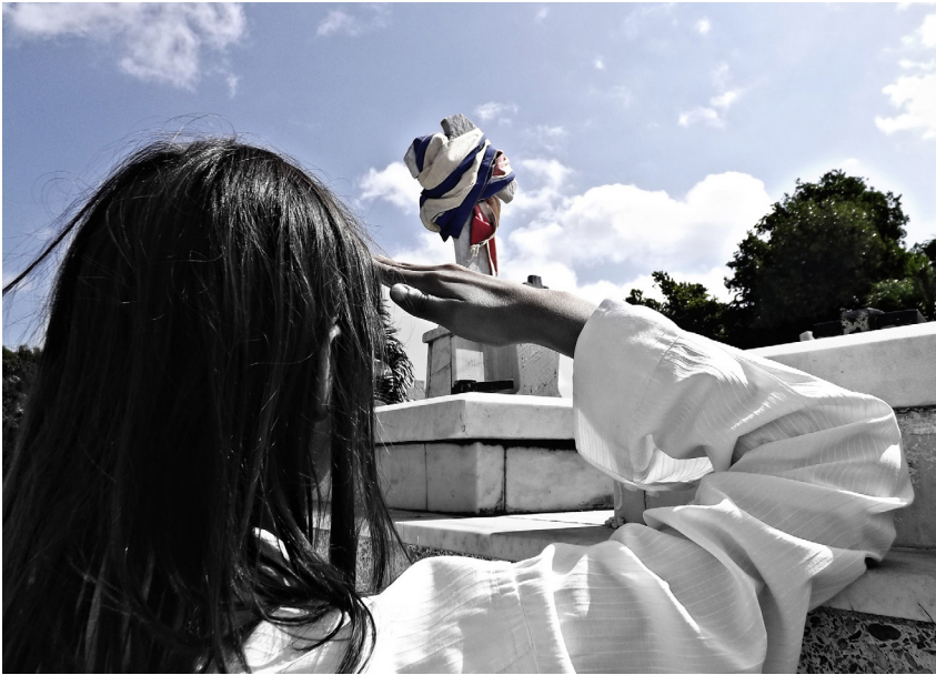
Al combate corred....