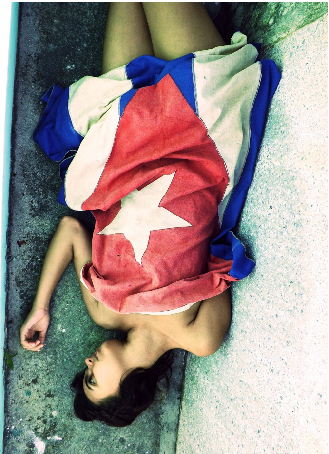
Otras formas de estar